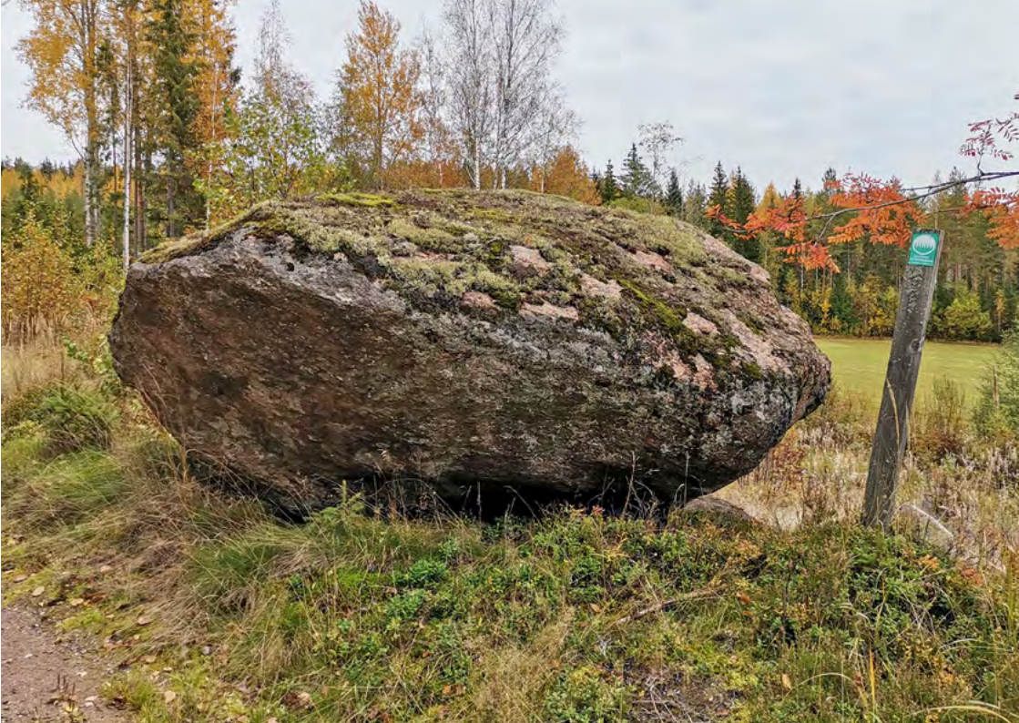
Heiluva kivi, Kouvola.

Kiinteistönomistajan vastuulla on huolehtia, että luonnonmuistomerkin läheisyydessä tapahtuvat metsän- tai pihapiirin käyttö- ja hoitotoimet eivät vahingoita tai merkittävästi heikennä luonnonmuistomerkin elinolosuhteita tai sen ominaispiirteitä.