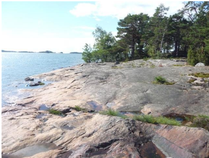
Bild 2. Öppet berg vid stranden.