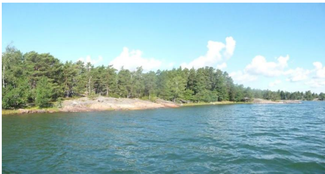
Bild 5. Panoramabild av stranden.