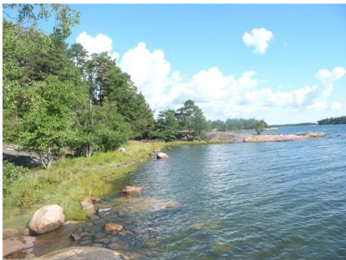
Bild 3. Strandvegetation och albestånd sett mot norr.