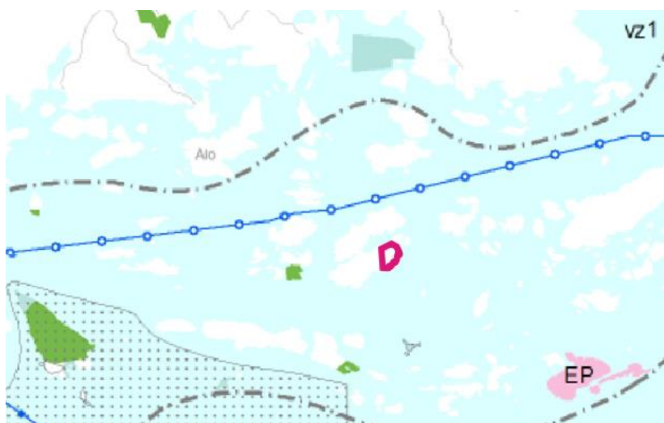
Utdrag ur landskapsplanen, fastställd 8.11.2006. Planeringsområdet markerat med röd linje

Beredningen av Nylands fjärde etapplandskapsplan är på gång. Planens syfte är att stöda hållbar konkurrenskraft och välmående inom Nyland. Den fjärde faslandskapsplanen kommer att vara mer strategisk än de tidigare landskapsplanerna. Sakområden som kommer att beröras är näringsformerna och innovationsverksamhet, logistik, vindkraft, grönstrukturer och kulturmiljöer. Ett utkast av landskapsplanen har varit till påseende i början av år 2015.