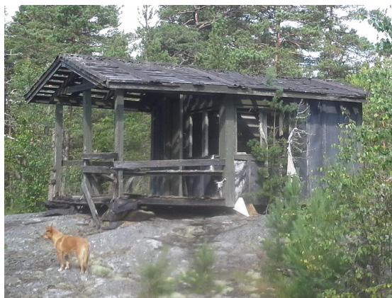
Kuva 8. Foto av den gamla rivningsansökta byggnaden på planområdets södra del.