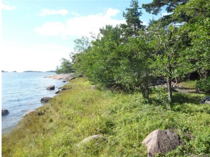
Bild 1. Strandvegetation sett mot söder.