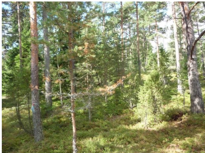
Bild 4. Blandskogen mitt på ön