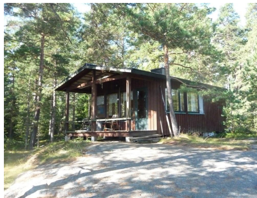
Bild 6 och 7. Fotografier av den nuvarande stugan och brygga på området.