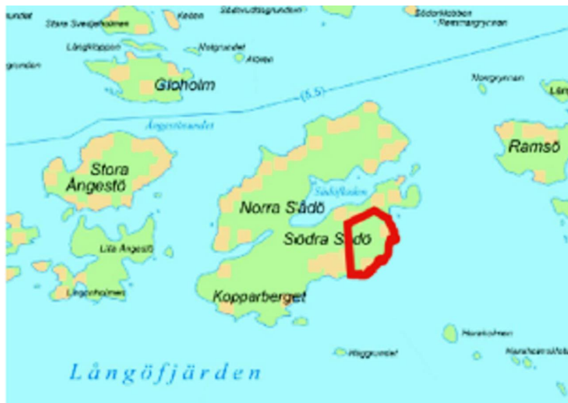
Planeringsområdet med röd linje

Planområdets storlek är ca 7,3 ha och innehåller inte vattenområden. Området är i sin helhet i privat ägo. Områdets stranddetaljplanering har ansökts av områdets markägare.