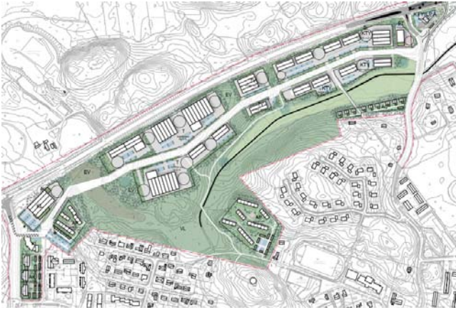
Ote luonnosvaiheen yleissuunnitelmasta.