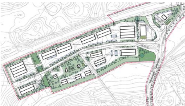
Kaavaluonnoksen havainnekuva, VE 2.

Nyt kyseessä olevassa kaavaehdotuksessa rakennettavia alueita on pienennetty alueen länsiosassa , joka sijaitsee lähimpänä asutusalueita. Alue on varattu ekologiselle käytävälle.