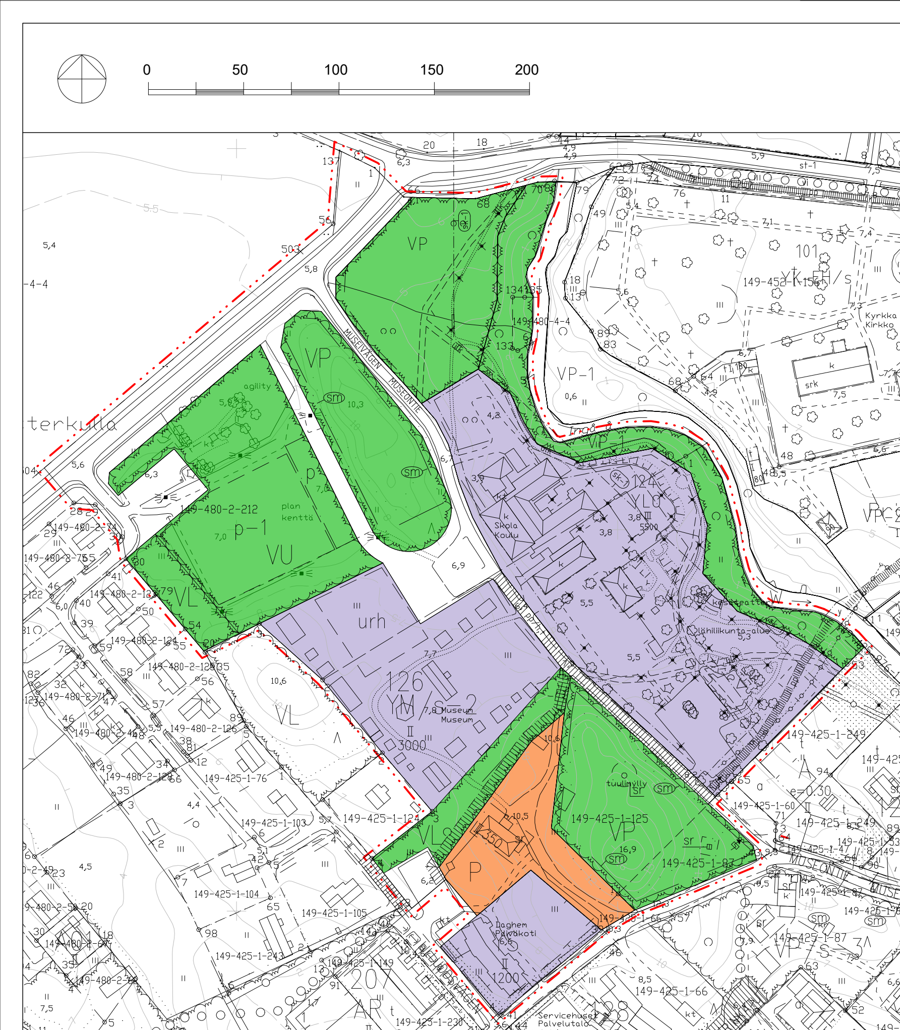
Planutkast alt 1 1:2000 Kaavaluonnos ve 1 1:2000