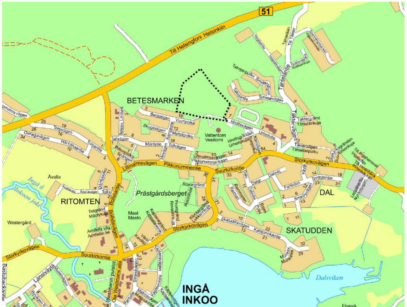
Kuva 1. Alustava suunnittelualan rajausta opaskarttaphyllä. Rajausta tarkentuu suunnittelun edetessä.

Rakennus- ja ympäristölautakunta 15.11.2022