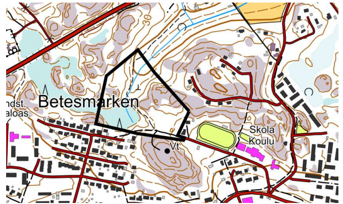
Kuva 2. Alustava kaava-alueen rajaus maastokartalla. Rajaus tarkentuu suunnittelun edetessä.

Uusimaa-kaava 2050 tuli pääosin voimaan 24.9.2021 Helsingin hallinto-oikeuden käsiteltä kaavakokonaisuudesta jätetyt valitukset. Hallinto-oikeus hylkäsi pääosan valituksista.