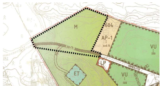
Kuva 5. Ote 11.1.1999 kunnanvaltuuston hyväksymästä rakennuskaavamuutoksesta. Mustalla rajauksella on esitetty Dahlskogen I asemakaavamuutoksen alueella voimassa oleva osa. Suunnittelualueen rajaus tarkentuu suunnittelun edetessä.