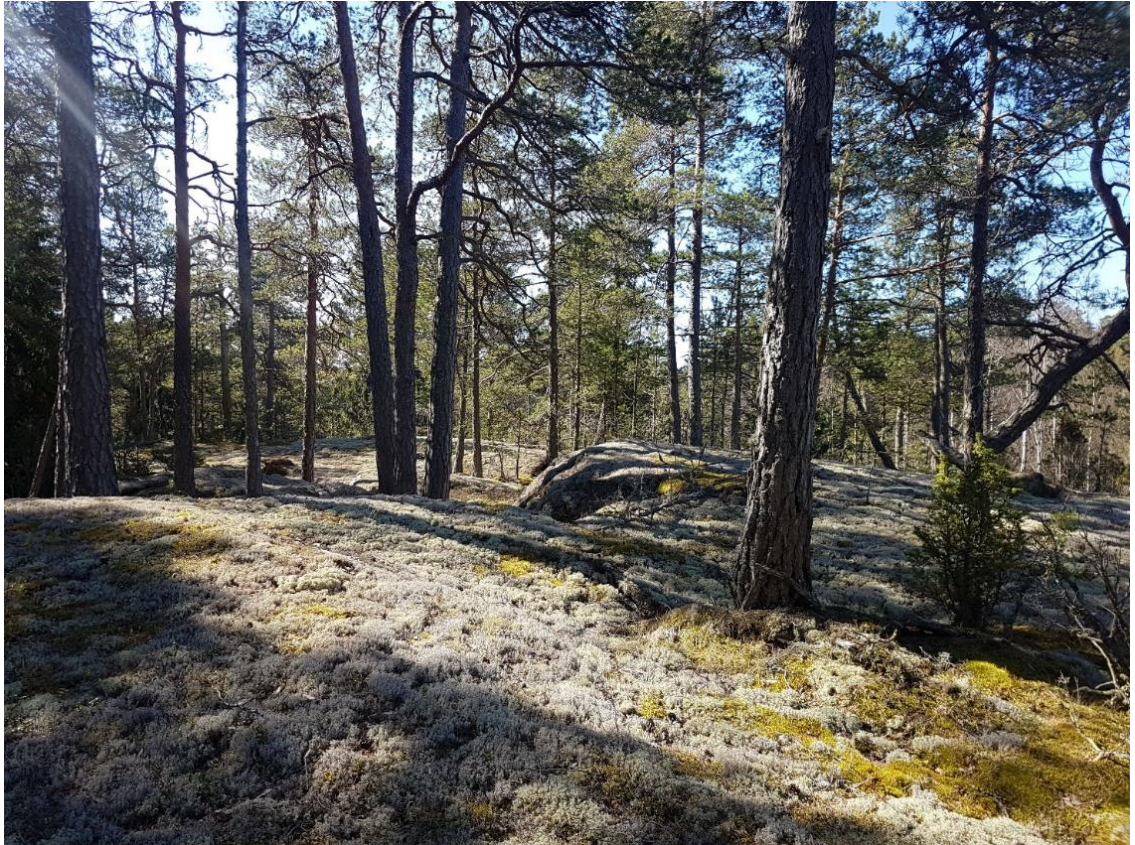
Kuva 5. Hycklebergillä kasvaa vanhaa ja kuivaa kalliomännikköä.