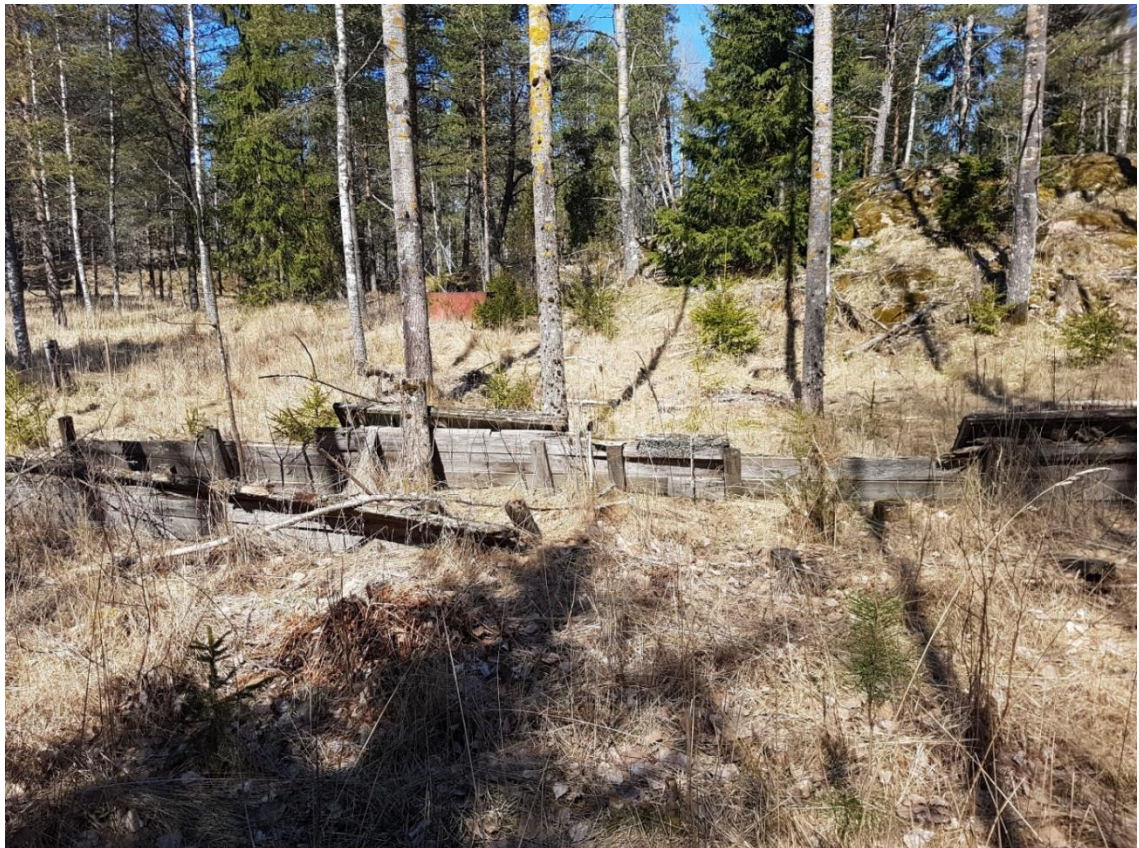
Kuva 2. Selvitysalueen länsiosat ovat kulttuurivaikutteisia. Haavikko kuviolla 4 on kasvanut entiselle avomaalle.

Notkon alaosa on voimakkaasti kulttuurivaikutteinen ja ilmeisesti entistä piha-alueita. Kuvion keskellä on vanhan rakennuksen jäänteet. Alueella on runsaasti vanhaa yhdyskuntajätettä sekä puuston raivaustähteitä.