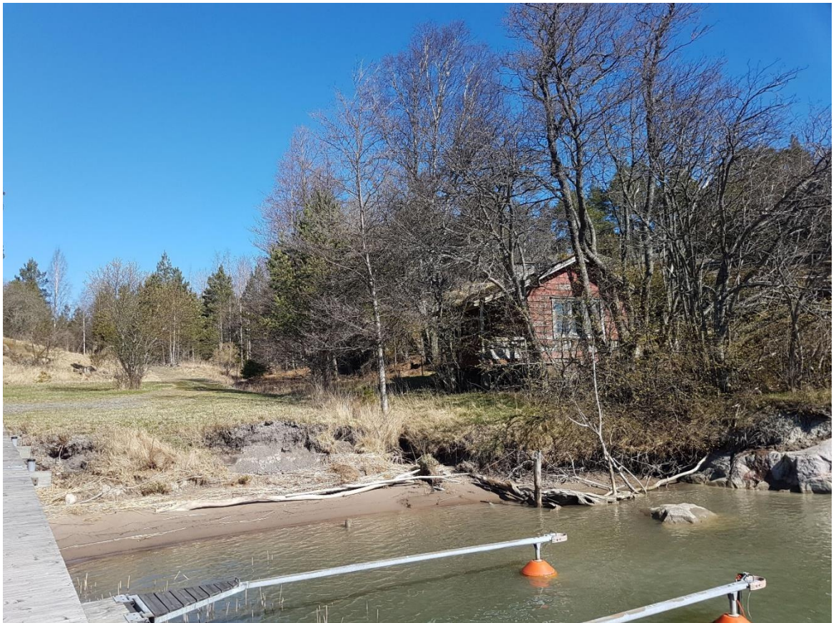
Kuva 3. Bergvallan saunan piha-alueetta kuviolla 5.

hedelmäpuu, ja alueella kasvaa mm. kevätesikkoa. Saunan eteläpuolella on pieni tervalepikko. Alueella on aktiivisessa käytössä oleva venelaituri.