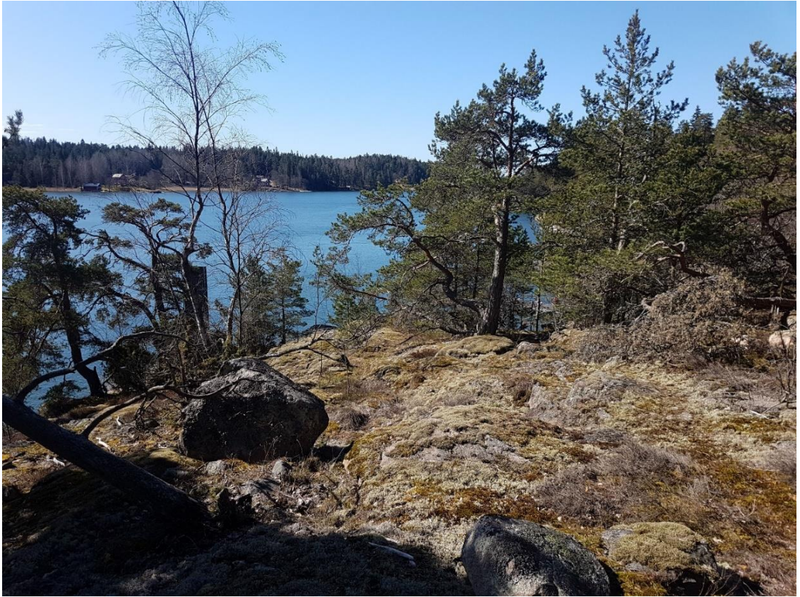
Kuva 4. Merelle avautuva näkymä Hycklesundin kalliolta.